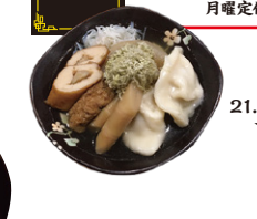
21.カラオケ居酒屋 一番星!

初登場 おでん水餃子 昆布を使った和風の味のほっとするおでんです。 販売価格/600円 カラオケ居酒屋 一番星! 黒部市三日市822阿原ビル2F TEL.52-4011 OPEN 16:00~24:00 月曜定休