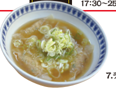
7.ラーメンショップ みやき

スープ水餃子 ネギがたっぷりのスープに入った水餃子です。どうぞお召し上がりください。 販売価格/530円 ラーメンショップ みやき 黒部市三日市3311 TEL.52-0118 OPEN 11:30~13:30 17:30~25:00 日曜定休