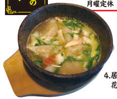
4.居酒屋ダイニング 花朝月夕

黒部名水あつあつ水餃子 自家製塩スープと野菜たっぷりの黒部の名水とたくさんの野菜を煮込んだ、ヘルシーでオリジナルの塩スープの水餃子。女性の方にもオススメです。 販売価格/842円(税込) 居酒屋ダイニング 花朝月夕 黒部市三日市1219-1 TEL.57-0771 OPEN 17:00~25:00 月曜定休