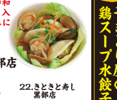
22.きととき寿し 黒部店

初登場 ハマグリとキャベツと水餃子 ハマグリとキャベツの和風スープに水餃子を入れて、ビールつまみにいかがでしょう。 販売価格/330円 きととき寿し 黒部店 黒部市前沢1549 TEL.57-2488 OPEN 11:00~21:00 無休