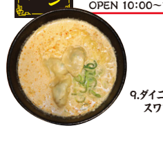
9.ダイニングcafé スワロー