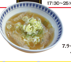
7.ラーメンショップ みやき