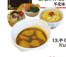
13.やくぜんそうざい Kuu

名水餃子のやくぜんスープカレーセット 体の中からデトックス!!薬膳効果で代謝を上げて、お肌つるつる元気がつら!! 販売価格/850円(税込) やくぜんそうざい Kuu 黒部市新牧野311 黒部ショッピングセンター「メルシー」内 TEL.32-4731 OPEN 11:00~19:00 不定休