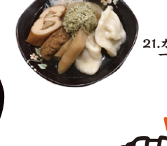
21.カラオケ居酒屋 一番星!