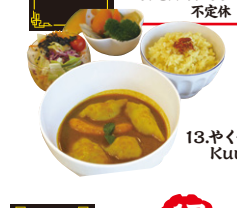
13.やくぜんそうざい Kuu