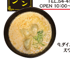
9.ダイニングcafé スワロー

みそ豆乳水餃子ラーメン 水餃子まつり期間限定メニュー!!豆乳スープは飲み干せる味わいです!他、水餃子野菜ラーメンもご用意。 販売価格/みそ豆乳水餃子ラーメン 850円(期間限定) 水餃子野菜ラーメン 850円 ダイニングcafé スワロー 黒部市新牧野311 黒部ショッピングセンター「メルシー」内 TEL.54-4111 OPEN 10:00~18:15